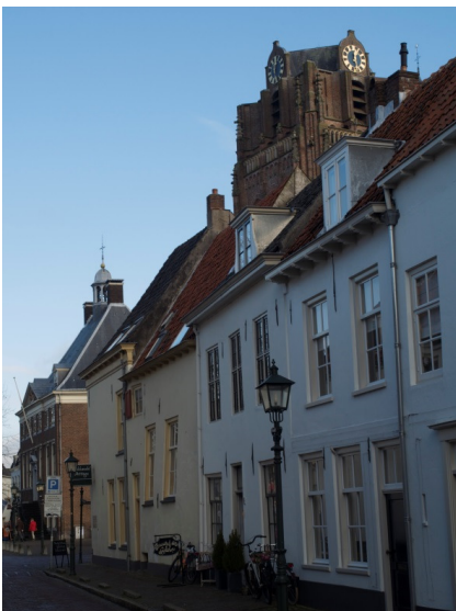
Vanuit volderstraat 12 Hendrikweg 4

In jaren negentig kwam er ook een einde aan mijn rondrit door Kerkenland. De protestantse gemeente in de Grote kerk op de markt werd "onze kerk". Dat dit Kerkenpad al voorbestemd was, blijkt als je vanuit onze huizen (Volderstraat, Prins Hendrikweg 9 en nu 4) in Wijk naar buiten kijkt. Met recht mijn kerk