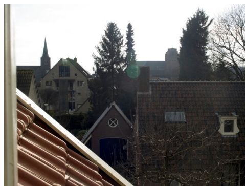
vanuit Prins Hendrikweg 9